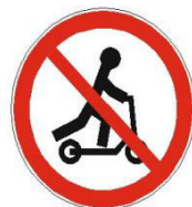
Рисунок 9. Дорожный знак 3.35 «Движение лиц на средствах индивидуальной мобильности, запрещено»

Мы катаемся на скейтах, Роликах и самокатах, Гироскутерах, моно-колесах. А по правилам, ребята? Мы должны понять, что СИМы – Средства транспортные тоже! Знание правил их вождения. Жизни сохранить поможет!